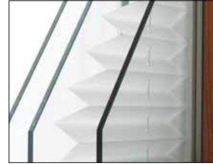
STORE PLISSE Idéal pour une décoration élégante pour habiller vos menuiseries.