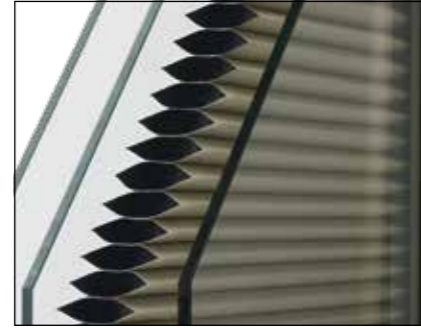
STORE DUETTE La solution parfaite pour occulter une chambre à coucher sans avoir l'encombrement d'un volet roulant.