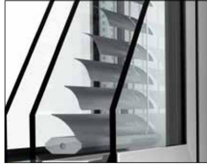
STORE A LAMELLE Idéal pour jouer sur la lumière : voir sans être vu.