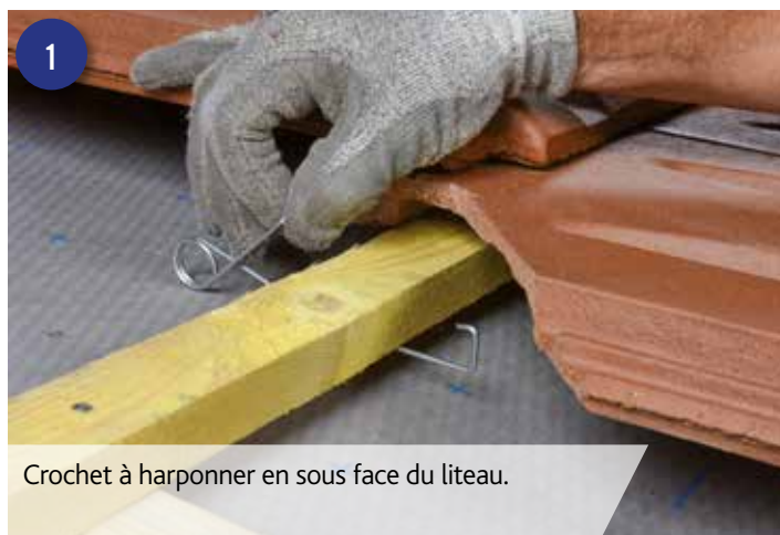
1 Crochet à harponner en sous face du liteau.