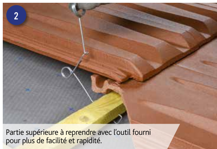
2 Partie supérieure à reprendre avec l'outil fourni pour plus de facilité et rapidité.