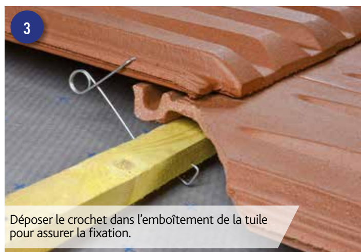
3 Déposer le crochet dans l'emboîtement de la tuile pour assurer la fixation.