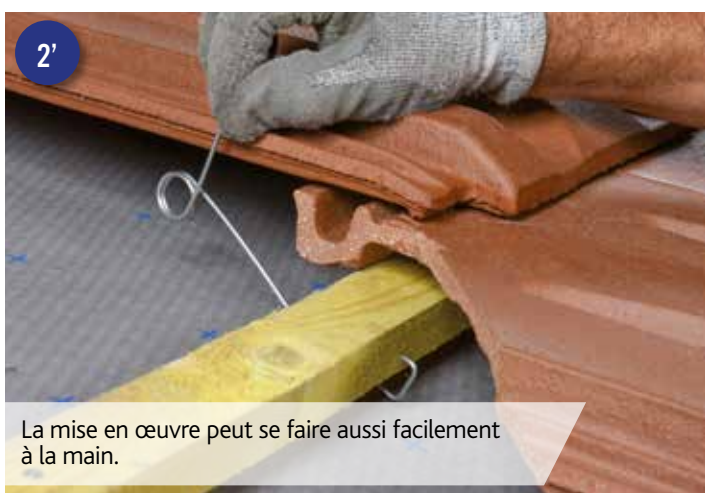
2' La mise en œuvre peut se faire aussi facilement à la main.